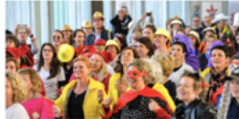
En 2015, lors de la dernière édition physique, plus de 700 participants avaient rejoint l'événement.