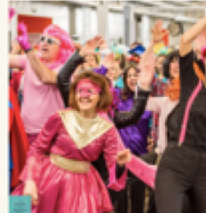
Une ambiance festive pour découvrir notamment l'avenir à

Écrit par Thérèse Vertès et Emmanuelle Hardy