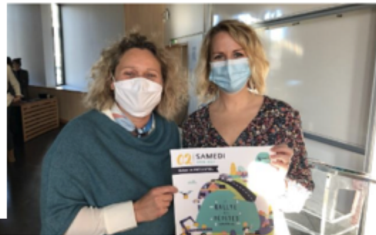
11/02/2022 | Ludique, informatif, et porteur de valeurs, le Rallye des Pépites propose une autre manière de découvrir les acteurs de l'économie locale.