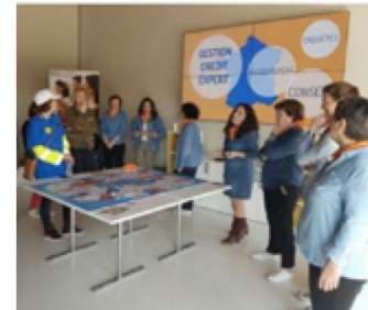
www.placeco.fr - 9 février, 18:20