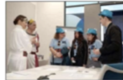
Le Rallye des Pépites offre découvrir et connaître