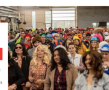
Visita viva à promouvoir la place des femmes en entreprise.

Visita, qui met en relation des entreprises bordelaises avec le grand public, revient le 2 avril prochain. Un évènement participatif, de fédérer leurs salariés tout en travaillant leur marque employeur.